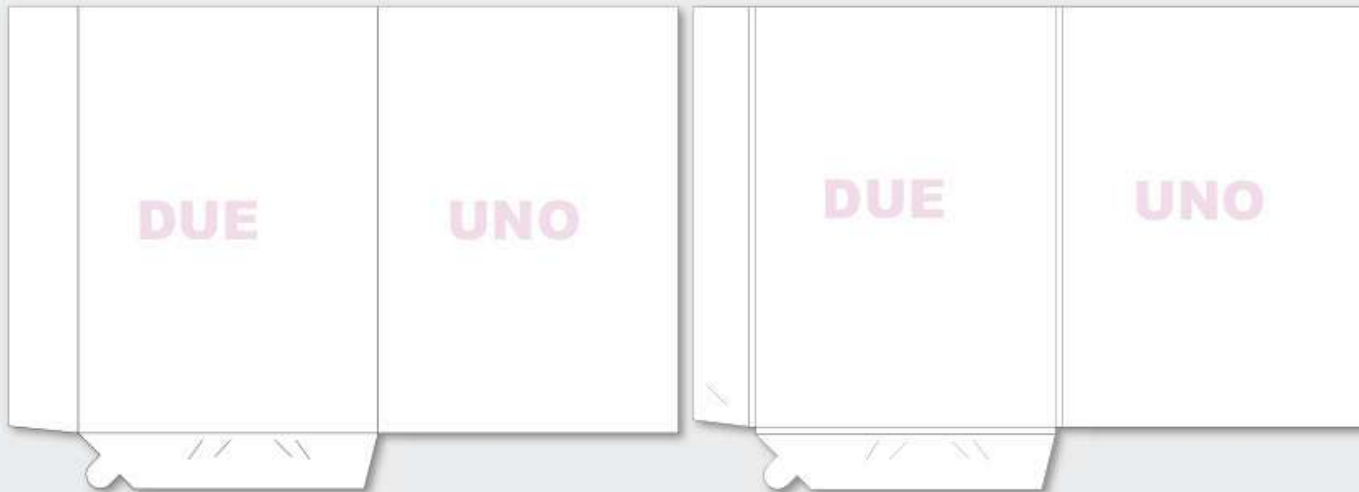
A4 2 ante - Cordonatura semplice